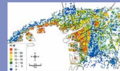
大阪・神戸地域の液状化危険度マップ (PL値が大きいほど危険度が高い)

大阪地域では海溝型の南海トラフ地震と直下型の上町断層帯地震による沖積砂層の液状化被害が予想されています。そこで、地盤情報を集約して作成した「250mメッシュ地盤モデル」によって液状化危険度マップを求めています。また、その対策として「地下水低下水法」を適用すること、さらに地下水を有効利用する方策も提案しています。以上のような地下水制御による地盤防災と環境保全に関する研究を行っています。