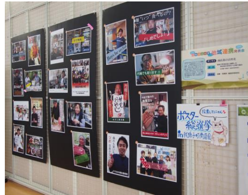
今年のポスター発表内容