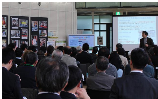
昨年の発表会の様子

この発表会は、今年で2周年を迎えた当センターと、本学教員及び学生が地域と連携して行った取り組みを広く学内外に紹介し、地域と大学が連携していくためのノウハウを共有することを目的としています。また、大阪府内の行政機関と大学のさらなる連携の可能性について議論を深め、今後の課題を模索するとともに、さらなる地域の活性化・発展に貢献していきたいと考えています。地域連携に関心のある方はもちろんのこと、プロジェクト運営などに興味のある方のご参加もお待ちしています。